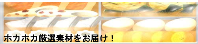
ホカホカ厳選素材をお届け！